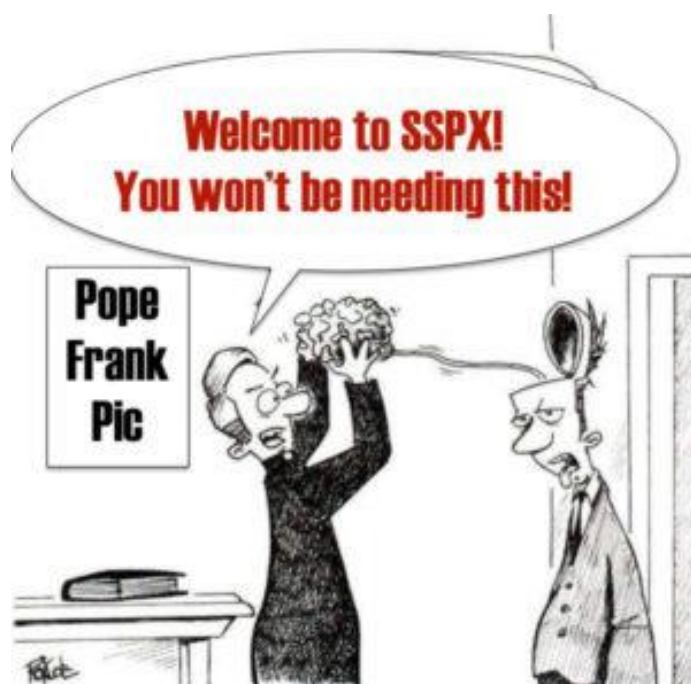
Wyłączanie mózgu w FSSPX

I tak było zawsze w FSSPX: Masz podążać za "linią" Bractwa – jak to głosił abp Lefebvre w moich czasach albo bp Fellay obecnie – jako właściwym stanowiskiem w każdej z dziesiątek trudnych spraw, przed którymi stają wierni katolicy w okresie po Vaticanum II . Masz potwierdzać, kiedy Bractwo potwierdza i zaprzeczać, kiedy zaprzecza i jeśli jednego dnia jego lawirujące i zmienne stanowisko przeczy temu, co Bractwo powiedziało dzień wcześniej, to masz udawać, że tego nie zauważasz – wiedząc, że ci, którzy wykazują lojalność wobec jakiegokolwiek zasady wykraczającej poza "stanowisko Bractwa" du jour (z dnia dzisiejszego) wkrótce znajdują się poza nim.