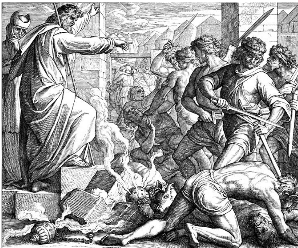
Mojżesz rozkazuje karać śmiercią czcicieli złotego cielca

krzywoprzysięzców i innych wszelkich zbrodniarzy. Dlatego czytamy u Mojżesza (Gen. 9, 6): "Ktobykolwiek wylał krew człowieczą, będzie wylana krew jego"; podobnie dalej (Exod. 22, 18): "Czarownikom żyć nie dopuścisz". I karę tę wykonywano rzeczywiście. Mojżesz wezwał mężów z pokolenia Lewi przeciw bałwochwalcom, co kłaniali się cielcowi złotemu, i kazał poodbierać im życie: jakoż zabito ich przeszło 20000, poczym Mojżesz pochwalił owych lewitów, mówiąc (Exod. 32, 29): "Poświęciliście ręce wasze dzisiaj Panu".