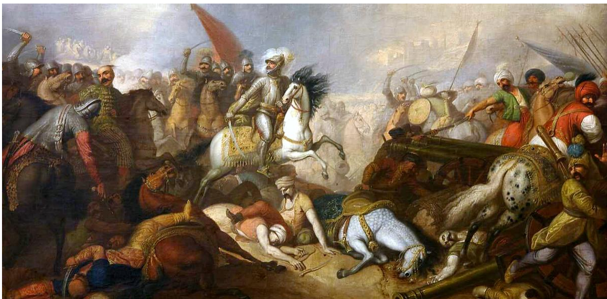
Bitwa pod Chocimiem (1673 r.)

b) Wolno dalej pozbawić życia nieprzyjaciela w śluszej obronie ojczyzny . Całość i bezpieczeństwo ojczyzny przedniejsze trzyma miejsce przed życiem nieprzyjaciół, tych, co się na nią targają. Nieprzyjaciele sami sobie winni, jeśli, krzywdę wyrządzając innemu krajowi, giną śmiercią. Skoro tedy zwierzchnik kraju prowadzi wojnę, każdy zawezwany do broni ma obowiązek stawać do szeregów. W takich razach dla uzyskania zwycięstwa wolno używać wszelkich środków potrzebnych, o ile nie zakazuje ich prawo przyrodzone czy też prawo narodów. Wolno tedy w takim razie uprzedzić nieprzyjaciela, napaść kraj jego i każdego, kto by się opierał, pojmać, zranić czy zabić. Zwłaszcza każdy żołnierz ma obowiązek walczenia mężnie wśród bitwy. Natomiast, jak już powiedziałem, grzeszyłyby, gdyby zabijał lub znieważał albo bezcześcił mieszkańców spokojnych, bezbronych, czy to dzieci, czy niewiasty, czy starców, czy też takich żołnierzy, co broń już złożyli. W ogólności żaden żołnierz nie powinien zapominać o tym, że jest chrześcijaninem, że ma być mężnym ale nie krwi chciwym i okrutnym.