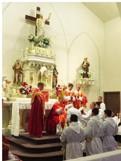
After touching the chalice & paten, the subdeacons are invested in the amice, maniple, and tunic