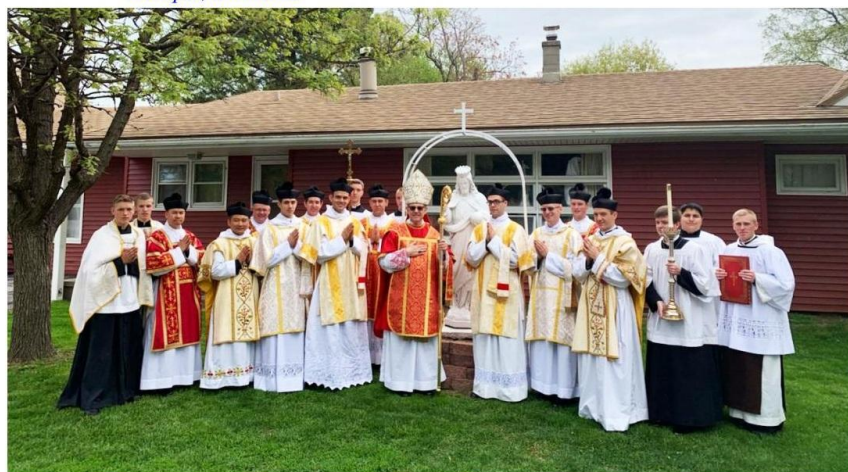
A beautiful spring day in Nebraska for our seminary group picture

Artykuł z czasopisma "The Reign of Mary", nr 172, Spring 2019 ( www.cmri.org ) (2)