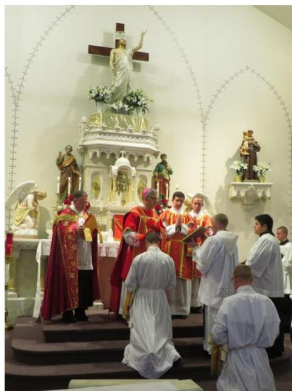
The imposition of hands for the matter of the diaconate