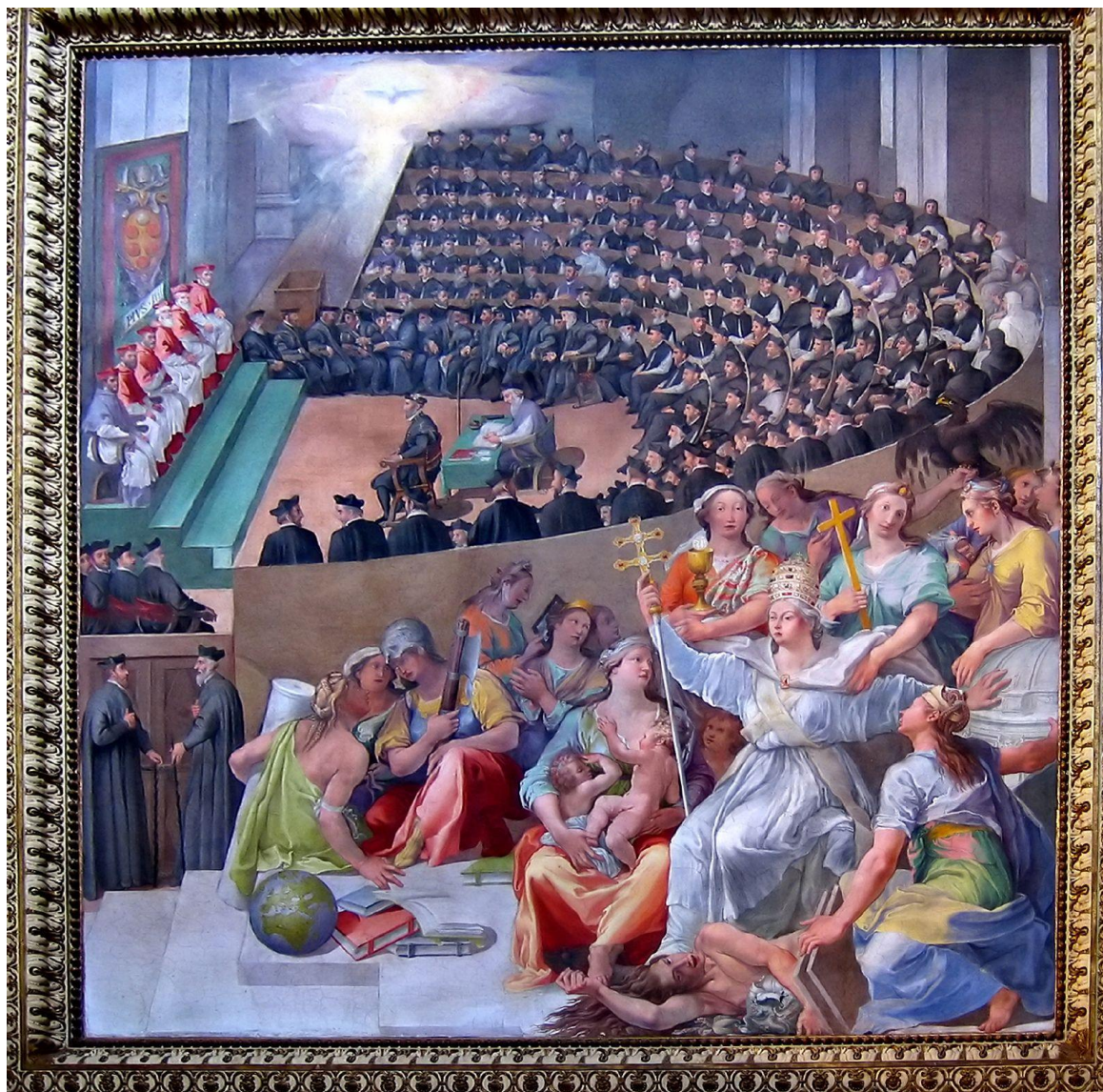
Kościół triumfujący ( Ecclesia Triumphans ) niszczy herezję; w tle święty Sobór Trydencki (Pasquale Cati, 1588)