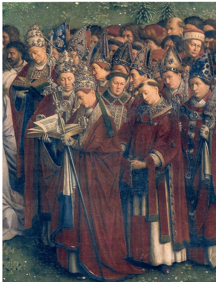
Papieże i biskupi (Jan van Eyck, Ołtarz Gandawski, 1432)

"Nauką de fide jest to, że ludzie dostępują zbawienia również przez chrzest pragnienia, na mocy kanonu Apostolicam , « de presbytero non baptizato » i sesji 6, rozdział 4, Soboru Trydenckiego, gdzie mówi się, że nikt nie może się zbawić «bez kąpieli odrodzenia lub bez jej pragnienia»".