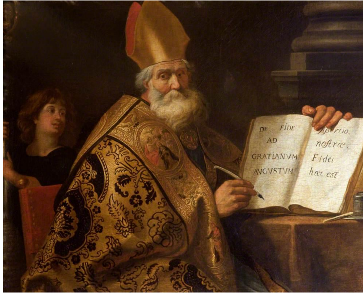
Św. Ambroży, Ojciec i Doktor Kościoła (338-397), Biskup Mediolanu