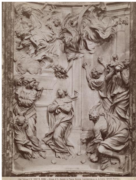
Płaskorzeźba: Męczeństwo św. Emerencjany (Ercole Ferrata, 1660), kościół św. Agnieszki w Rzymie (Sant'Agnese in Agone)

Od chrztu z wody, który nosi nazwę baptismus fluminis , odróżnia się chrzest z ognia albo ducha czyli z żądzy ( baptismus flaminis ) i chrzest krwi ( baptismus sanguinis ); przez te dwa ostatnie rodzaje chrztu może być dopełniony chrzest we właściwym znaczeniu, jeśli udzielenie tego chrztu jest niemożliwe. Pierwszy z nich (tj. chrzest z ducha) jest pełnym nawróceniem do Boga poprzez żal doskonały lub miłość, o ile zawiera wyraźne lub przynajmniej domyślne pragnienie otrzymania chrztu z wody... Chrzest z ducha ( flaminis ) i chrzest krwi są nazywane chrztem pragnienia ( in voto )".