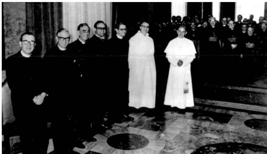
Paweł VI pozuje z sześcioma luterańskimi teologami zasiadającymi w specjalnej komisji mającej zmienić Mszę

Nigdzie w tej definicji nie znajdujemy słowa ofiara, którą w rzeczywistości jest Msza; ponadto rola kapłana sprowadza się do zwykłego przewodniczenia, a sama duchowa obecność Chrystusa jest wynikiem zgromadzenia się "ludu Bożego". W istocie to Luter stwierdził, że: "Msza nie jest ofiarą... nazwijcie to błogosławieństwem, Eucharystią, Stołem Pańskim, Wieczerzą Pańską, Pamiętką Pańską lub jakkolwiek chcecie, jeśli tylko nie skalacie jej mianem ofiary... Msza nie jest ofiarą. To nie jest akt składającego ofiarę kapłana".