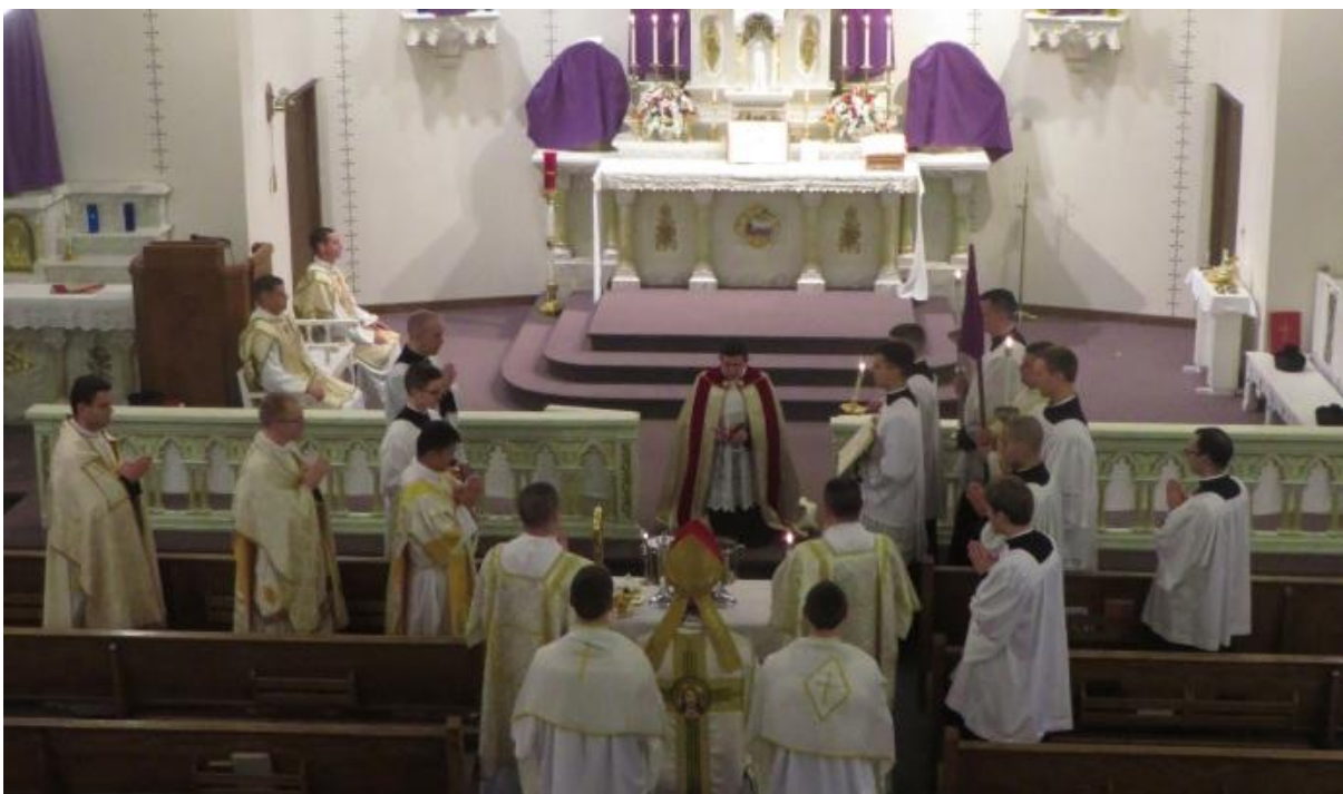
Błogosławieństwo Świętych Olejów podczas Mszy Krzyżma