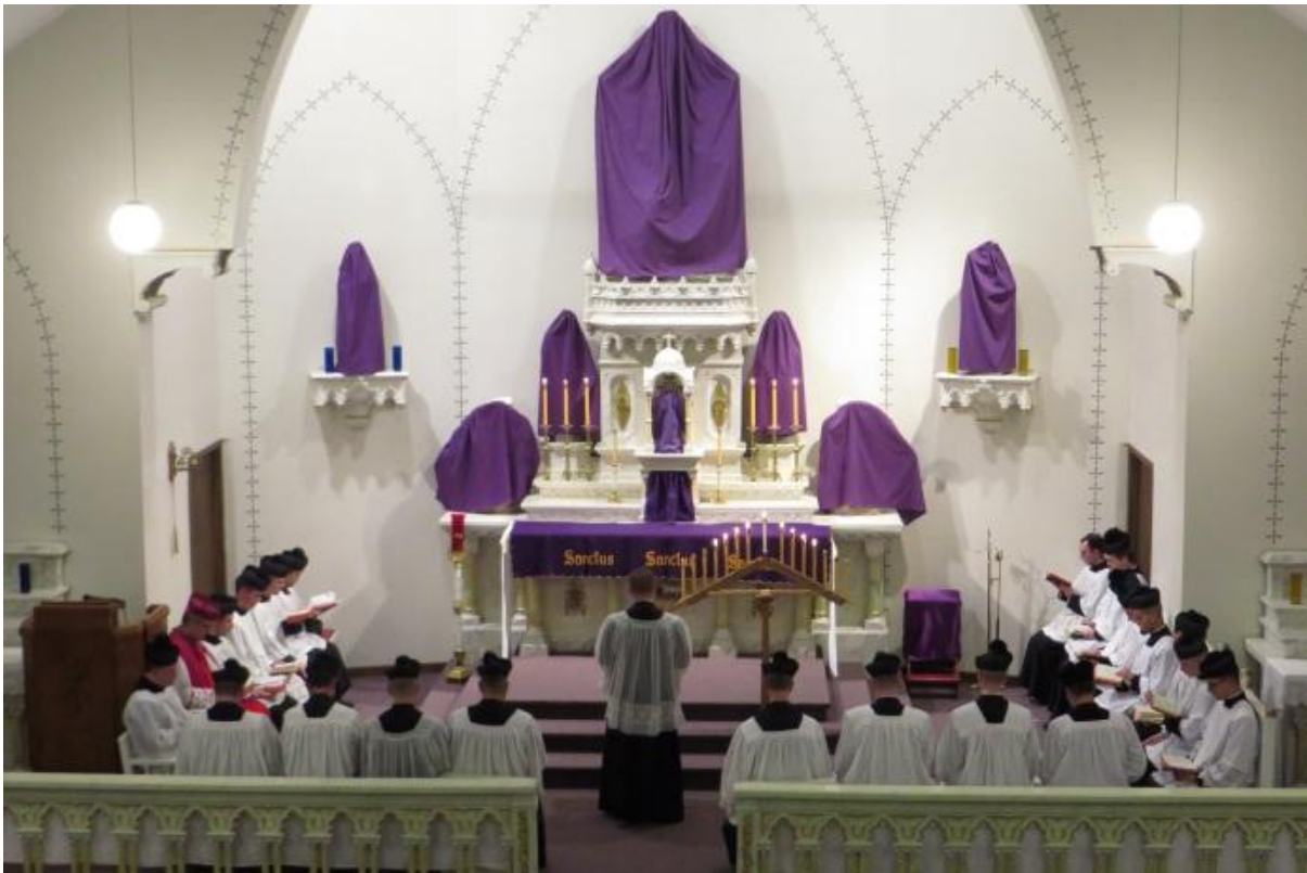
Dwudziestu trzech duchownych i seminarzystów uczestniczyło w śpiewie Tenebrae